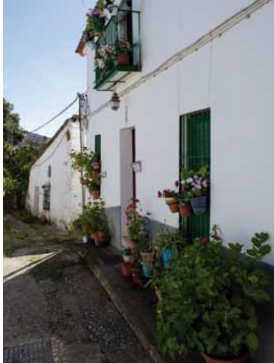
Calle de Corterrangel. Las macetas con geranios en las fachadas.

Desde Santa Ana descendemos hasta el vado de la Rivera de Santa Ana, y desde aquí nuestra ruta transcurre en paralelo a la carretera, al pie de la Sierra de la Virgen. Pasaremos por las aldeas del Cabezuelo y El Collado , hasta llegar a Alájar . Esta localidad, de unos 800 habitantes, destaca por sus bonitas calles empedradas. Aquí se encuentra la Peña de Arias Montano, monumento natural, donde se retiró el famoso humanista, y también la Ermita de Ntra. Señora de los Ángeles, todo ello ladera arriba del pueblo. En nuestro camino atravesamos la localidad, y comenzamos el ascenso hacia el puerto de Linares, uno de los puntos más altos de la ruta. Desde aquí, un fuerte