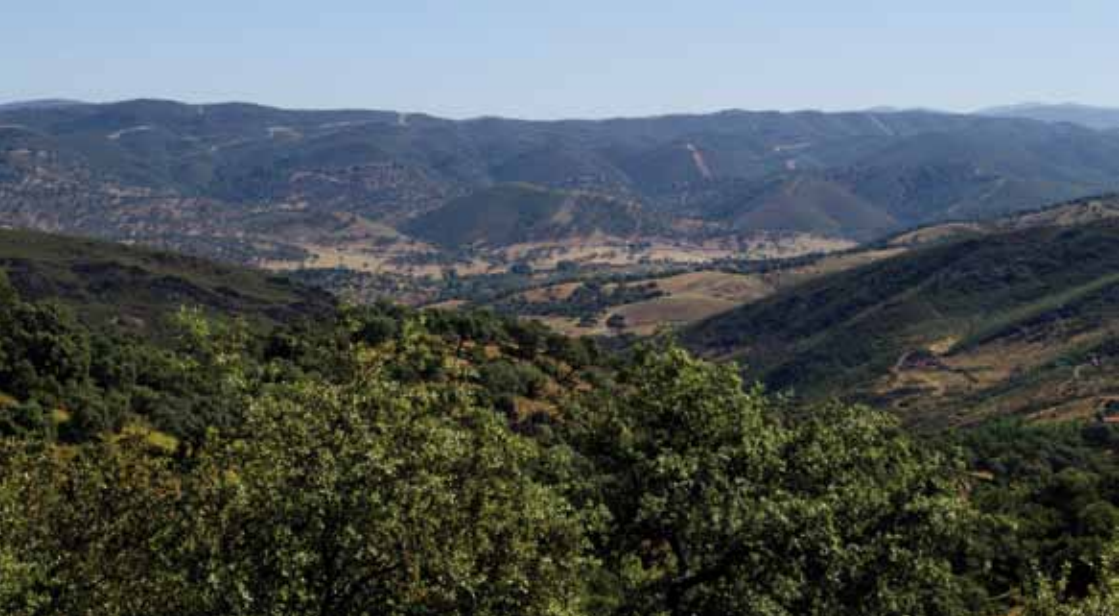
Vistas hacia el valle de las Buervas desde el Alto de la Barquera.

nuaremos nuestra ruta hacia Navahermosa. Pasamos ahora por la pequeña y humilde aldea de Corterrangel , cuyo origen se remonta a la época medieval y que actualmente cuenta con una decena de habitantes. Caminaremos entre pequeñas parcelas ocupadas por huertas con frutales y hortalizas, olivar y castaños centenarios de impresionante altura. Durante la repoblación por parte de los astur-leoneses en el siglo XIV, se introdujo el cultivo del castaño con el fin de la explotación de su preciado fruto, la castaña. A día de hoy y varios siglos después, este recurso forestal sigue siendo muy importante en la comarca, aportando gran cantidad de jornales e impulso económico a familias enteras. Con más de 5.000 hectáreas, la Sierra de Aracena y Picos de Aroche es la zona de Andalucía de mayor extensión del castañar.