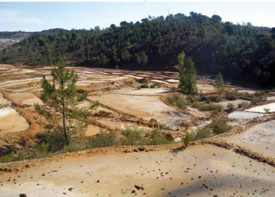
Terrazas para la decantación del mineral, junto al río.