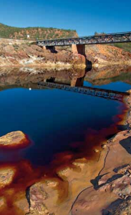
Río Tinto y Puente Cachán, Berrocal.

decir que no exista la vida, antes al contrario. Estas aguas contienen una comunidad de miles microorganismos únicos, que se alimentan de minerales, capaces de soportar condiciones extremas de acidez y carencia de oxígeno (por eso se denominan extremófilos). De hecho, si un trozo de hierro cae al río dura muy poco, devorado por estas bacterias (ha sucedido con vagones de las minas). Las recientes investigaciones han descubierto que el color rojo y las condiciones de acidez son generadas por los propios organismos que lo habitan. Es decir, que el río Tinto no estaría así por la contaminación, sino que este ecosistema es así desde hace cientos de miles de años, y son los propios microorganismos los que lo han modelado para sus necesidades. Buena parte de estos impresionantes descubrimientos científicos se han producido