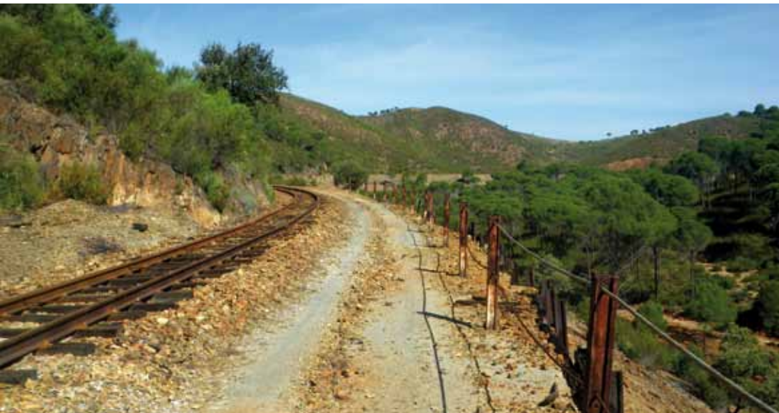
Camino junto a la vía del ferrocarril turístico minero.

Las aguas carecen de oxígeno, no hay en ellas peces, ni anfibios, pero eso no quiere