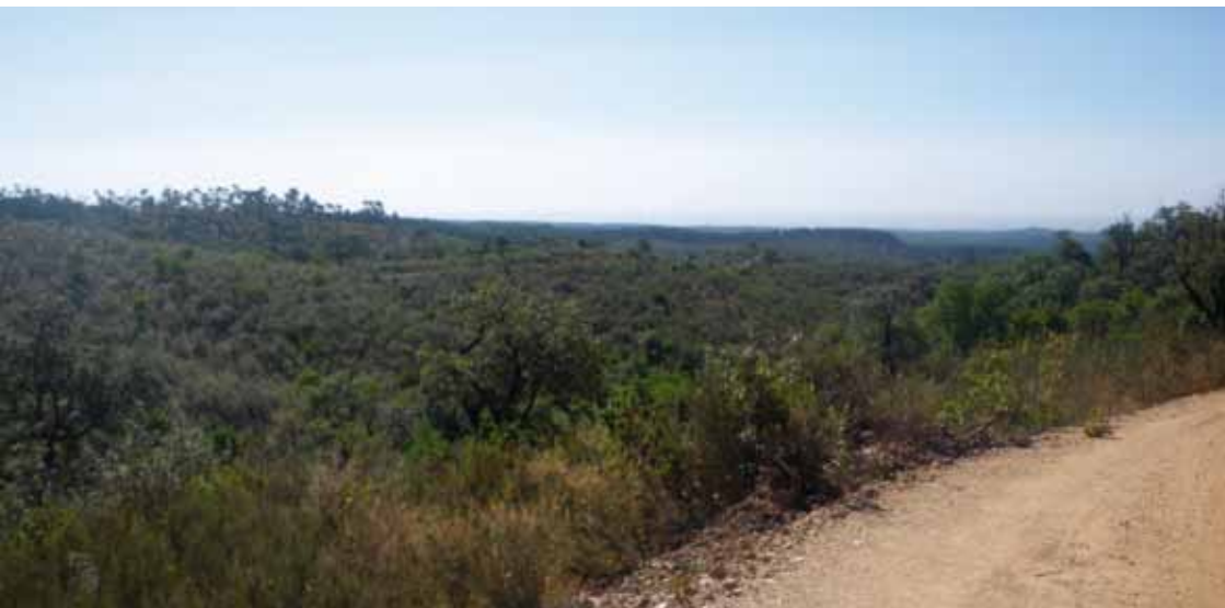
Panorámicas desde los altos de la Cuesta del Carril.