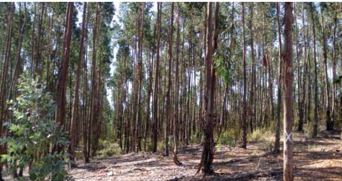
Plantación de eucaliptos.

saliendo a la izquierda por la vereda del Alpizarejo. Desde el camino, a la izquierda veremos el Castillo de Alpízar, fortaleza de origen Almohade, declarada BIC, y el acebuchal del mismo nombre, declarado Lugar de Interés Comunitario (LIC). Y a la derecha la aldea de Tujena, que se asienta en las proximidades de donde estuvo la antigua población prerromana y romana de Tejada la Nueva, fundada en la minería entorno al río Corumbel. En ella se celebra anualmente la romería de S. Isidro Labrador, muy popular en Paterna. Nuestro camino entre olivares nos lleva a pasar junto a una antigua canteira, y luego a vadear el río Corumbel, que es un afluente del Tinto, y cuyo nombre proce-