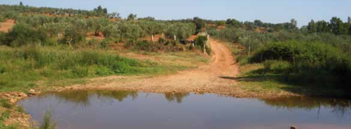
Vado del río Corumbel.

de del latín Columbari (río de las palomas), lo que de nuevo nos remite a la importancia de estos territorios en la época romana.